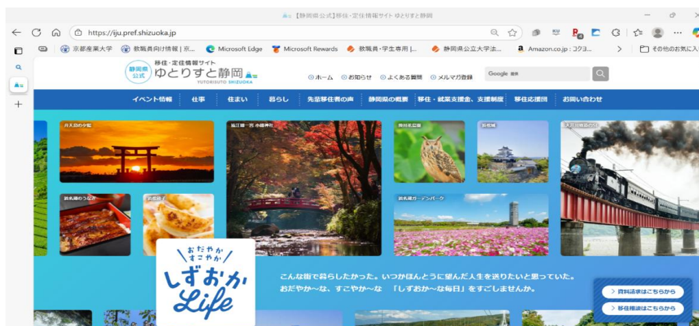
図1 「ゆとりすと静岡」のトップページ